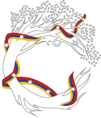
MEMORIAS POR LA VIDA

La censura encuentra su vía de escape en el arte